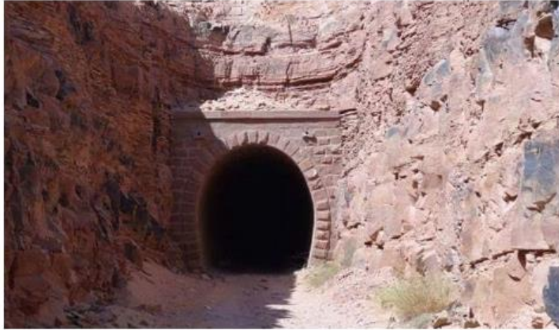
*Hicaz Demiryolu, Bir tünel geçidi 11