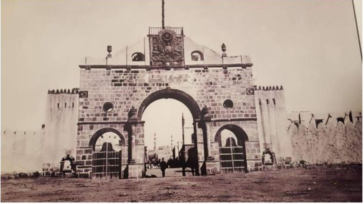
*Hicaz Demiryolu, Medine İstasyonu, Suudi Arabistan 5