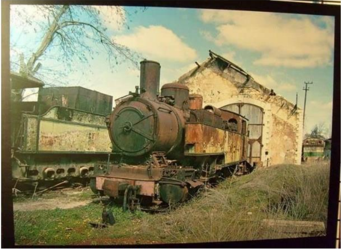
*Hicaz Demiryolu, Rayak Tren İstasyonu, Lübnan 12