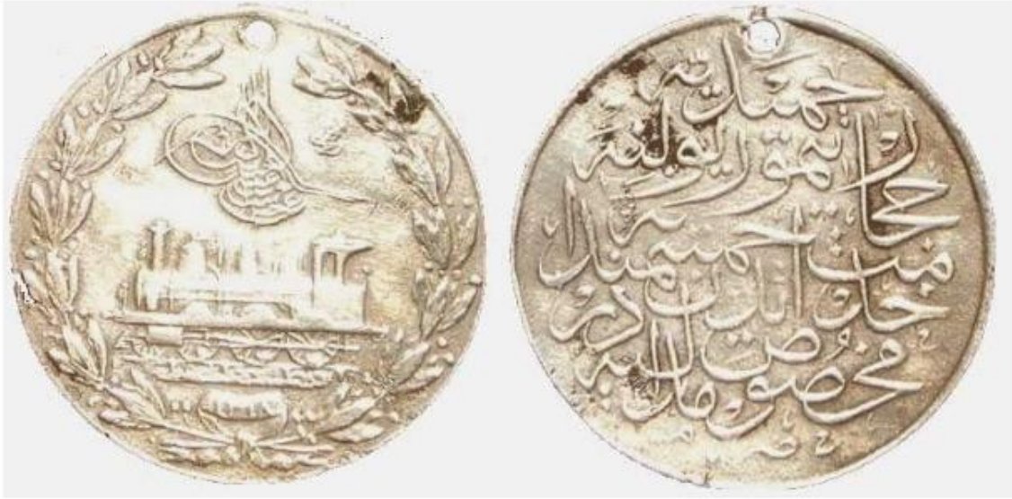
*Hicaz Demiryolu Ma'an Mevkiinin Açılışı Madalyası, 1904 -15