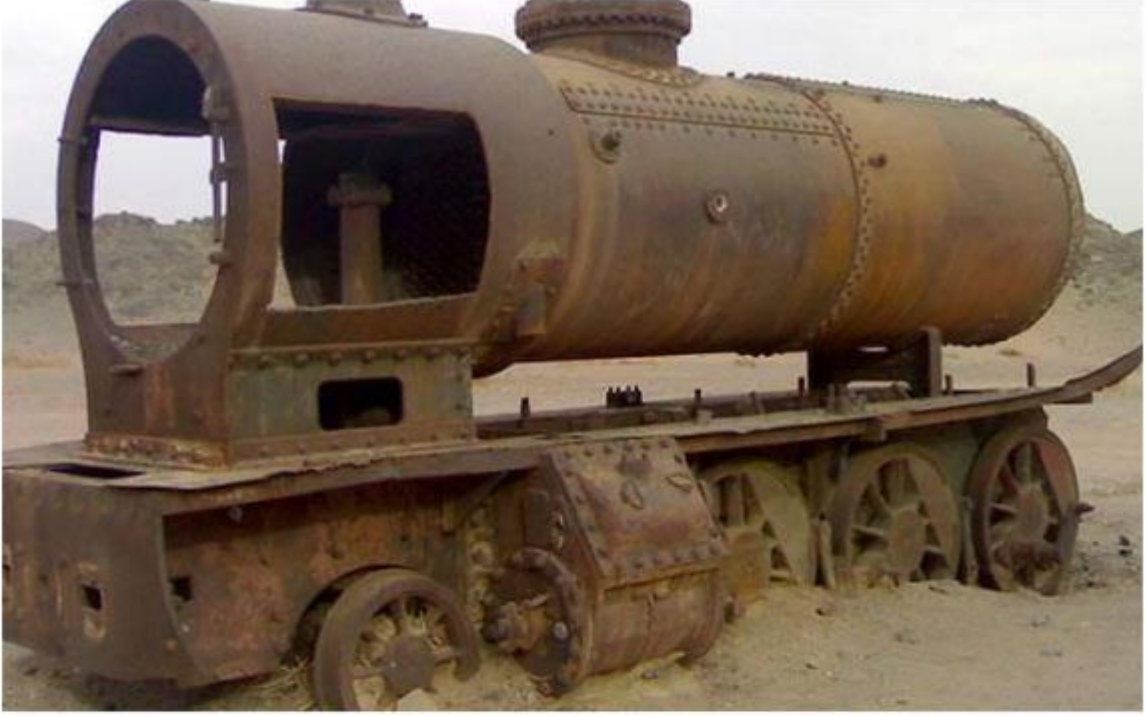
*Hicaz Demiryolundan Kalanlar 7