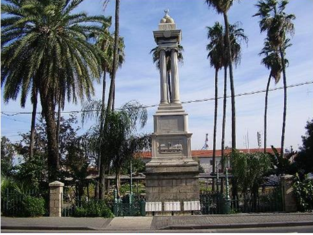
*Hicaz Demiryolu Hayfa İstasyonu, İsrail 1