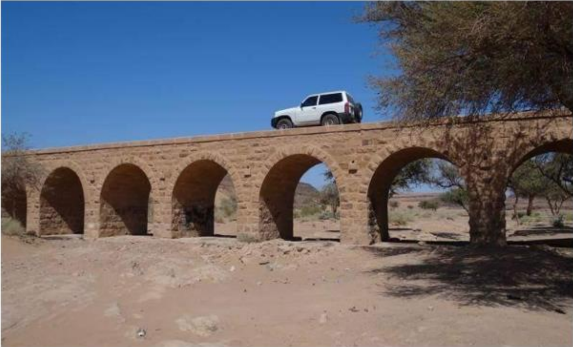
*Hicaz Demiryolu Köprü Geçişi 4