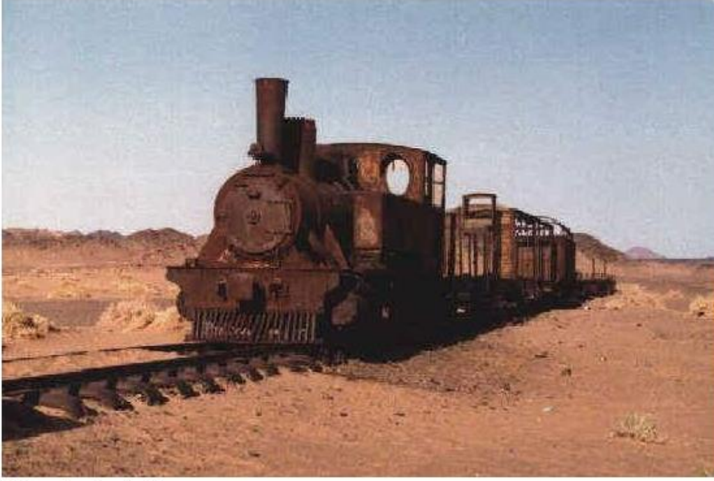
* Hicaz Demiryolu 14