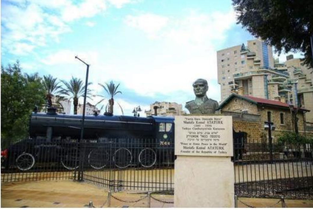
*Beer -Sheva istasyonu, İsrail 3