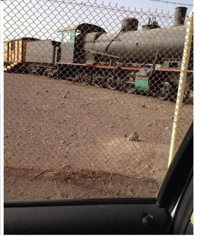
*Hicaz Demiryolu, Tebük İstasyonu 9,10 (Yunus Turanlı)