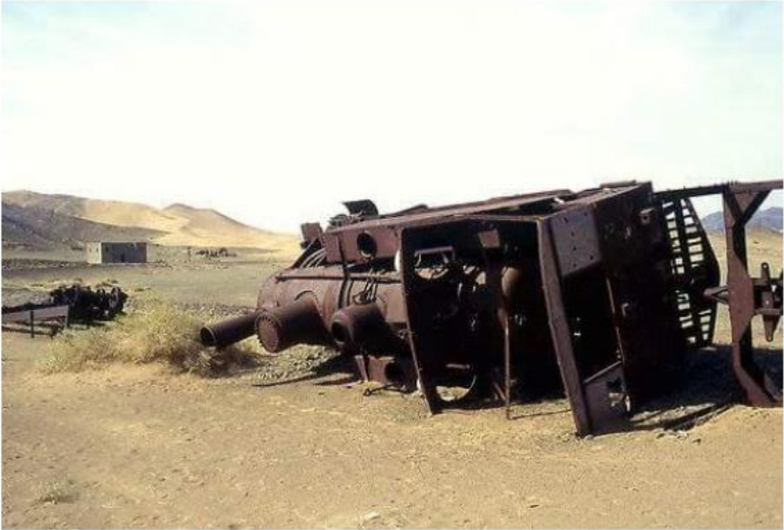
*Hicaz Demiryolu'ndan kalanlar 8