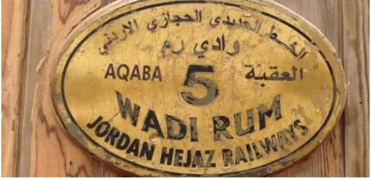
*Hicaz Demiryolu 16