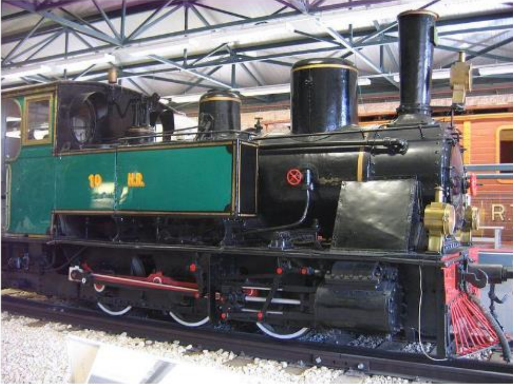
*1902'den beri korunmuş Krauss buhar lokomotifi, İsrail Demiryolu Müzesi, Hayfa 2