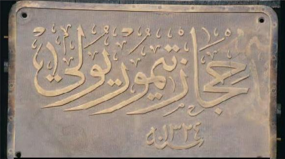
* Osmanlı Türkçesiyle 'Hicaz Demiryolu' yazan pirinç levha 6