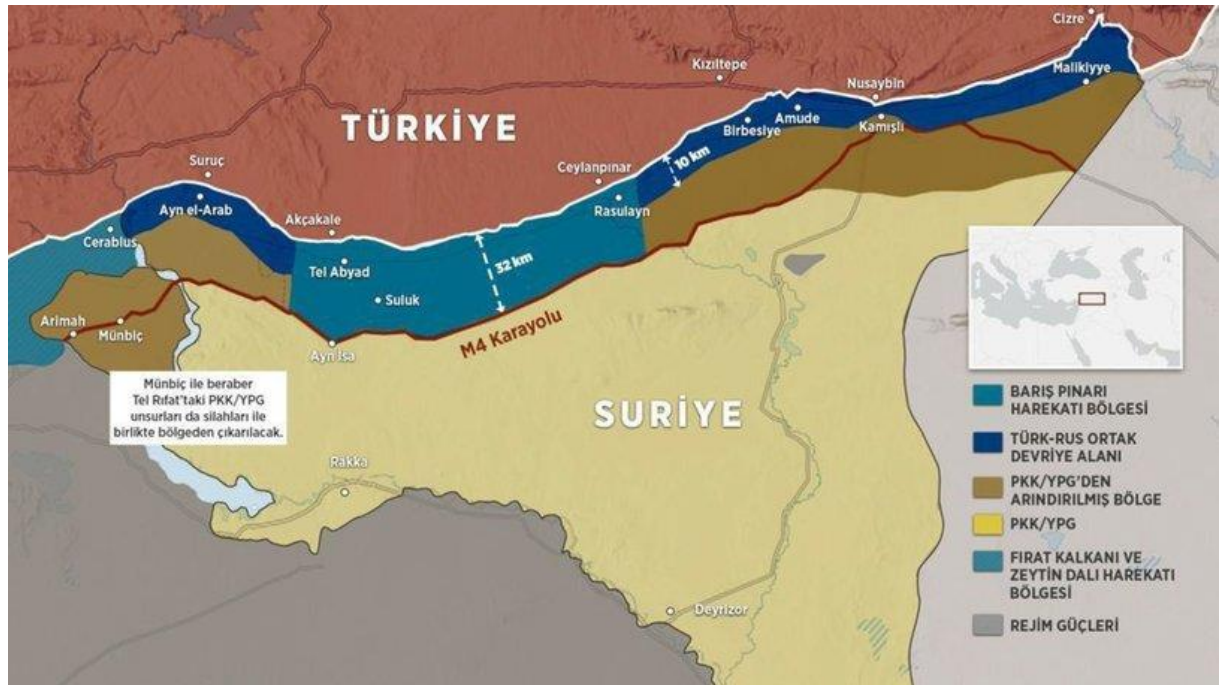
*Barış Pınarı Harekât Bölgesi

22 Ekim 2019'da Rusya devlet başkanı Putin ve Türkiye Cumhurbaşkanı Erdoğan, PKK/YPG'nin sınır bölgesinden ve Tel Rıf'at ile Menbic'den 30 kilometre uzağa çekilmesi için ateşkes süresinin 150 saat daha uzatılması üzerine Soçi Mutabakatı'nda anlaşmaya vardı. Bu amaçla Rusya askerî polisi ve Suriye Silahlı Kuvvetleri'ne bağlı sınır muhafızları harekât alanının dışında kalan alana girmesi kararlaştırıldı. 23 Ekim günü Türkiye Millî Savunma Bakanlığı harekâtın sona erdiğini açıkladı. 29 Ekim günü Rusya, 68 askerî birlikteki 34.000 PKK/YPG'linin harekât bölgesinden çekildiğini duyurdu.