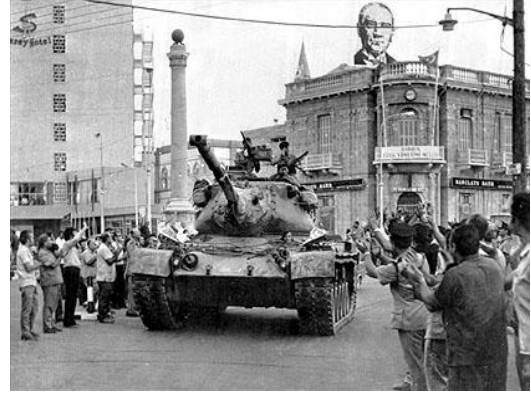
*TSK, Lefkoşa Sarayönü meydanında

Dışişleri yetkilileri bu düşünce ve planlarını 16 Temmuz'da İngiltere ve ABD'nin Ankara büyükelçiliklerine bildirdi. 16 Temmuz 1974'te muhalefet partilerinin başkanlarıyla da üç saate yakın bir toplantı yapan başbakan Ertesi gün konuyu müzakere için Londra'ya gitti. Kimi kaynaklara göre heyet henüz Etimesgut Askeri Havaalanı'ndan yeni kalkmışken Başbakan Vekili Erbakan Milli Güvenlik Kurulu'nu acil gündem koduyla toplamış; toplantı devam ederken Erbakan, dönemin Genelkurmay Başkanı Orgeneral Semih Sancar'a gemilerin yola çıkması için emir vermiştir.