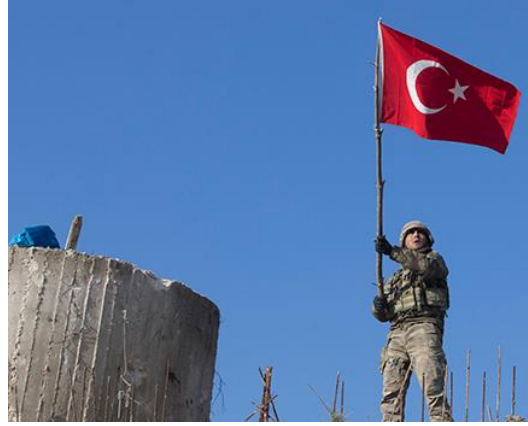
*Afrin'e bağlı Bursaya Dağı'nda Türk Bayrağı

20 Ocak 2018'de Türk Silahlı Kuvvetleri (TSK) ve Suriye Millî Ordusu (SMO) grupları tarafından Suriye'nin Halep ilinin Afrin ilçesi ile Azez ilçesine bağlı Tel Rifat kentine yönelik başlattığı askerî harekât. Türkiye, harekâtın amacının ülkenin varlığına tehdit olarak gördüğü ve terör örgütü olarak tanımladığı PKK, PYD-YPG ve Irak ve Şam İslam Devleti'ni (DEAŞ) bölgeden uzaklaştırmak, sınır hattının ve bölgedeki halkın güvenliğini sağlamak ve kontrol altına almak olduğunu bildirdi. Bu süreçte Türkiye'nin sınır illerine çok sayıda havan mermisi düştü ve halktan şehitler verildi.