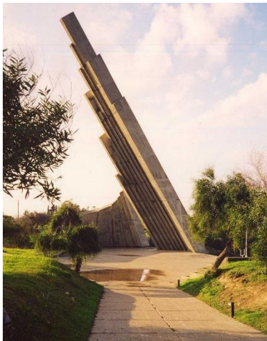
*Çıkarma Anıtı, Kıbrıs

Türkiye heyeti, İngiltere Başbakanı Harold Wilson, İngiltere Dışişleri Bakanı James Callaghan ve Kıbrıs meselesini görüşmek üzere Londra'ya gelen ABD Dışişleri Bakan yardımcısı Joseph Sisco ile ayrı ayrı görüşmeler yaptı. İngiltere ve ABD konuya Türkiye gibi yaklaşmamaktaydı. Bu arada Türkiye'de